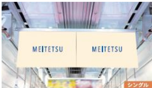
中吊（ワイド・シングル）