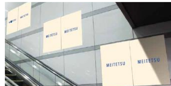
金山駅ポスタージャック