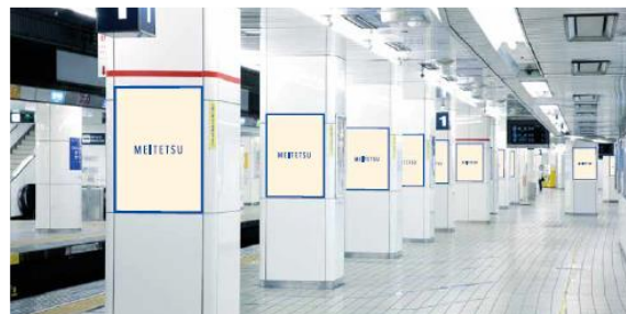
名鉄名古屋駅ポスタージャック