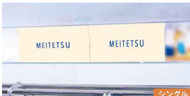
額面（ワイド・シングル）