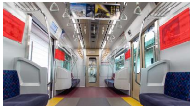
△掲出イメージ（ドア横4面の場合）