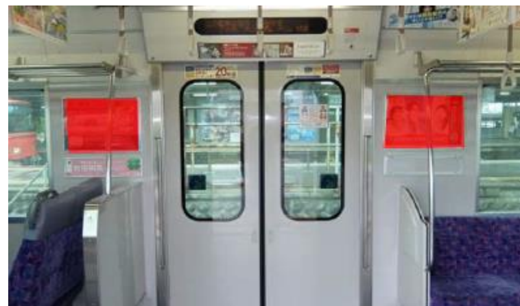
△掲出イメージ（ドア横2面の場合）