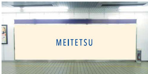
名鉄名古屋駅ビッグボード

◆対象媒体：名鉄名古屋駅ビッグボード、名鉄名古屋駅ポスタージャック、金山駅ポスタージャック