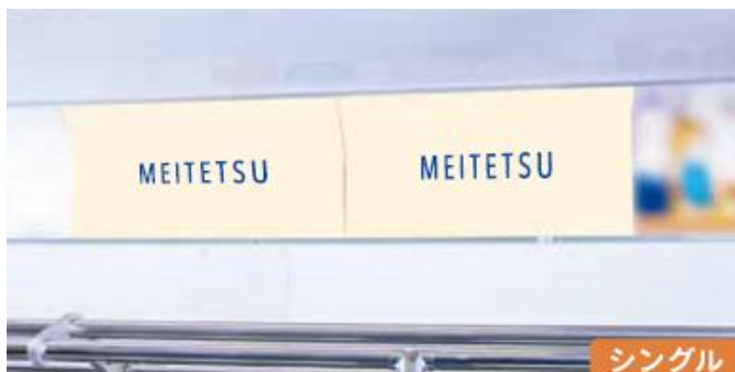
額面（ワイド・シングル）